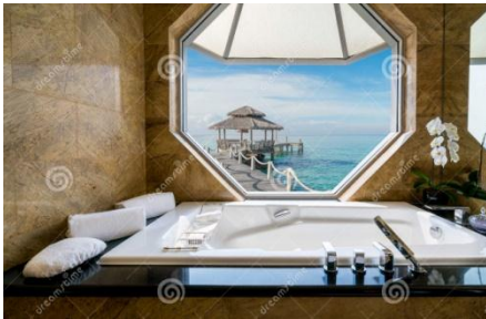
Gambar 4 View ke luar dari KM Hotel Resort Cat: Ke-dua sumber diakses 31 Agustus 2019

Dari menggambarkan keterkaitan desain dari ke-tiganya dapat di lihat dari beberapa desain di bawah ini: