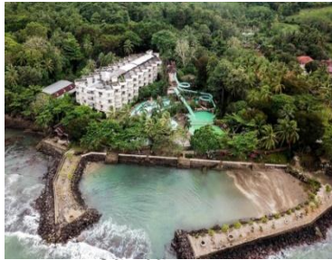
Gbr. Tapak Htl. Hawaii FS