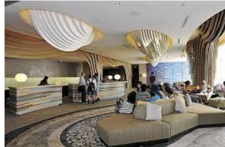
Gambar 5 Lobby sebuah Resort Beach Hotel