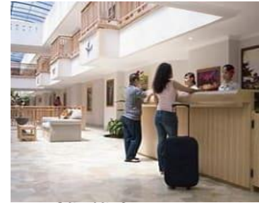
Receptionist Htl. Hawaii FS