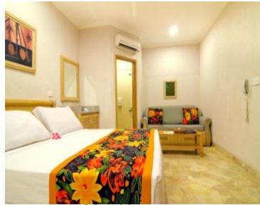
Interior Kamar Ht. Hawaii FS